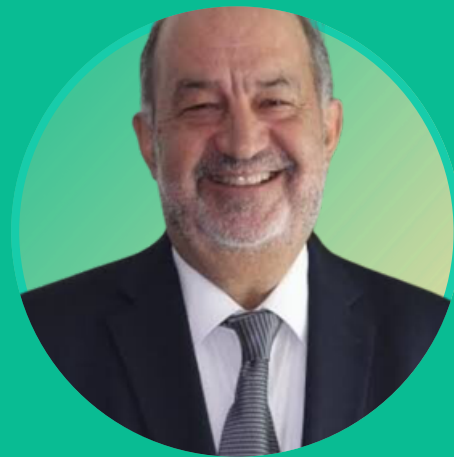
Odón de Buen Red por la Eficiencia Energética